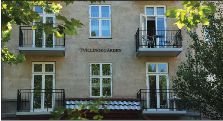
Altanerne er et stort plus for alle.

En anden udfordring var da hovedentreprenøren, der vandt licitationen, gik konkurs. Men der blev arbejdet effektivt og hurtigt, og fundet en løsning, så projektet kunne komme videre. Det sket med Hald & Halberg som ny hovedentreprenør.